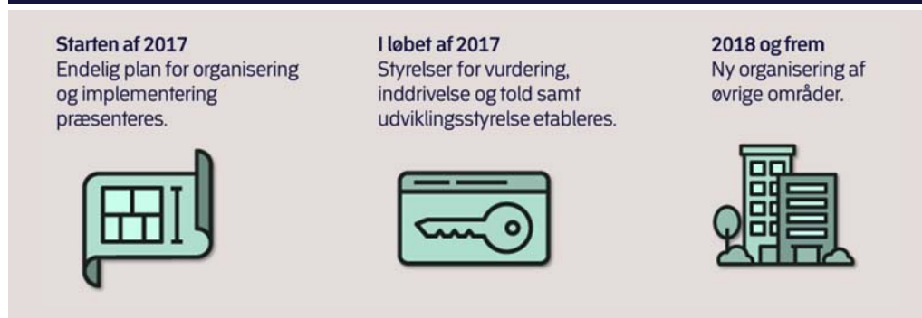
Figur 2. Tidsplan for implementering af det nye skattevæsen

Borgere og virksomheder skal således fremadrettet fortsat have én samlet indgang til skatteforvaltningen, selv om flere forretningsområder drives som selvstændige styrelser. Den samlede implementeringsplan for det nye skattevæsen forventes fremlagt i starten af 2017.